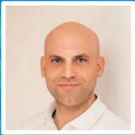
Stefan Biermair Physiotherapie Spiraldynamik® Cranio Sacral Therapie